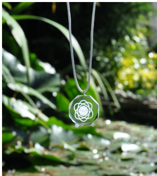
Přívěšek kruh PROMETHEUS - 2D logo dvacetistěnu s 3 orbity, křemíkové sklo

Emočně pociťová složka naší osobnosti má povahu magnetickou. Ve skutečnosti má obrovskou sílu a v kombinaci s elektrickou složkou přímo generuje aspekty naší reality, které se následně skládají do celku, který vidíme a vnímáme. Ve skutečnosti kolem sebe vidíme to, co jsme "naskládali" do kolektivního vědomí lidstva. Naše individuální moc je založená na naší schopnosti si vybírat z aspektů, které jsou v kolektivním vědomí uloženy, a pokud si vybíráme to, co se nám líbí, tak kolektivní vědomí posouváme tímto směrem. Opačně to funguje také, takže lidé, kteří se nechávají pohltit strachy a vidí kolem sebe vše špatné, působí v opačném směru. Nicméně síla pozitivního výběru je mnoho násobně silnější.