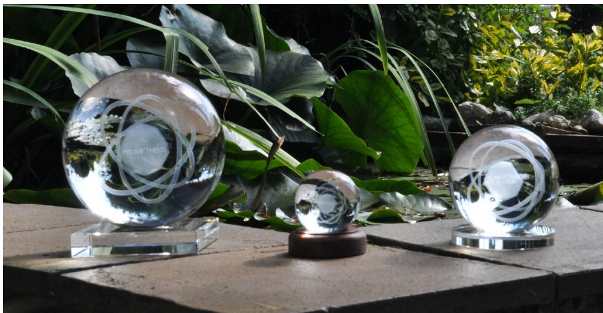
Vibrační zářiče PROMETHEUS - 3D logo dvacetistěnu s 3 orbity, koule 15/6/10 cm - křemíkové sklo

S oučasná doba je velmi nepřehledná. Většina z nás byla vychovávána v tzv. materii, tedy světě, který bez elektřiny, nafty, počítačů, ... nepřežije. Naučili nás, že naše fyzické tělo, se narodí a vcelku brzo zemře, přestože máme jeden z “nejlepších” lékařských systémů na světě - to je přeci normální. Od malička nám vkládají do hlavy co je správné a co špatné a podle jakých pravidel se máme řídit a hlavně žít. Hlavně si máme uvědomit, že jsme nic - jenom “malé děti”, které nic nezmůžou, “musíme” být někým (doktorem, právníkem), protože jinak nic nebudeme znamenat. Většina z nás zůstává těmi “malými dětmi” dobrovolně po celý dospělý život a ochotně si necháváme všudypřítomným systémem nadiktovat i to, kdy se máme oženit, v kolika letech máme mít další “malé děti”, kdy budeme mít první vážné nemoci a kdy máme ve finále umřít.