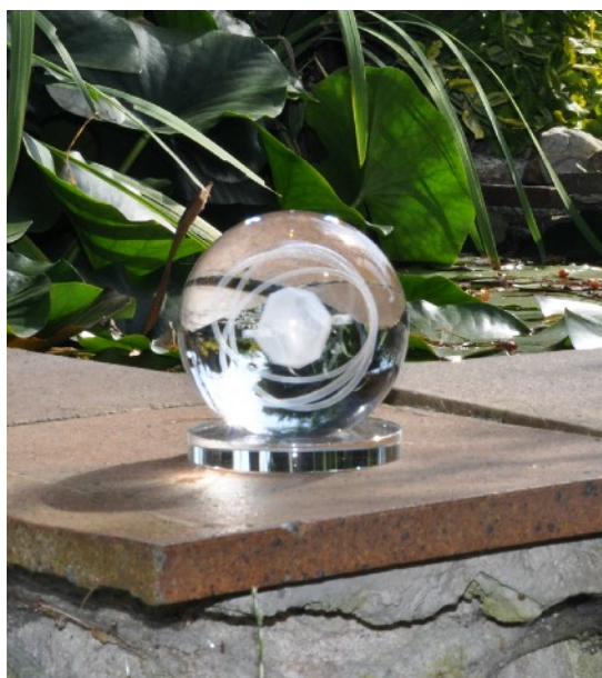
Vibrační zářiče PROMETHEUS - 3D logo dvacetistěnu s 3 orbity, 10 cm průměr křemíkové sklo

Náš organismus je neuvěřitelně dokonalý stroj. Z toho jak opravdu fungujeme je nám zřejmá pouze malá část. Pro naše správné fungování je potřeba si uvědomit, alespoň základní principy a to, že primárně fungujeme na základě reziduálních programů uložených v našem podvědomí a také to, že moc našeho povědomí postupně sílí s přibývajícím časem stráveným v hotelu ZEMĚ. Od okamžiku, kdy se narodíme, tak procházíme neuvěřitelně systematickým systémem učení se toho co nejsme, co musíme, co je správné a co špatné, jak se máme chovat abychom přežili. Když jsme děti tak se vzpíráme, nechceme fungovat podle pravidel našich rodičů, učitelů, farářů atp. Postupem času nás tento propracovaný systém dostane do kolejí, kde nás chce mít a postupně nás dokonce přesvědčí, že je to pro naše dobro a dokonce, že v něm máme svobodnou volbu.