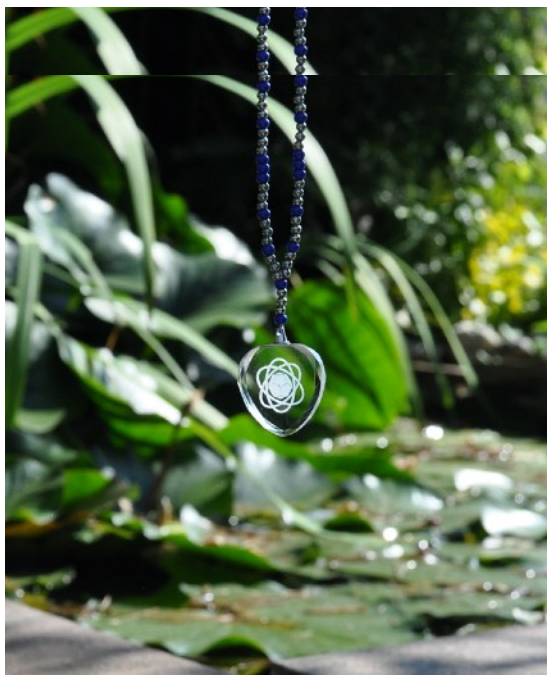
dvacetistěnu s 3 orbity, křemíkové sklo Přívěšek srdce PROMETHEUS - 2D logo dvacetistěnu s 3 orbity, křemíkové sklo

Pokud si tedy uvědomíme, že nemoci, neúspěchy a další nechtěné věci spojené s materiálním světem, mají nízké vibrace, tak je více než jasné, že má technologie PROMETHEUS přímý pozitivní vliv na kvalitu všeho kolem nás. Stejně přitahuje stejné - s vyššími vibracemi našeho organismu budeme přitahovat do života to chtěné :0).