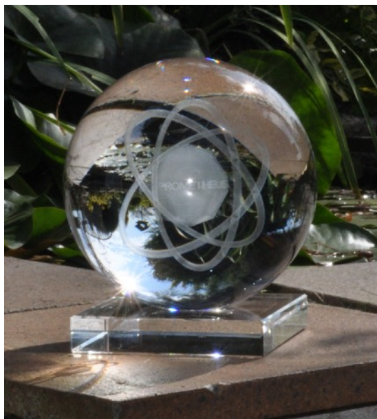
Vibrační zářič PROMETHEUS - 3D logo dvacetistěnu s 3 orbity, 15 cm průměr křemíkové sklo

a zjistili, že prožívání okolního světa je přímo odvislé od jejich vnitřního nastavení. Začali si uvědomovat, že žijí dle prapodivných schémat svých rodičů, učitelů a televizních seriálů. Přestali tolik myslet a začali se více spoléhat na své pocity, které se jim stali přesnou navigací v téhle hře, kterou tady na zemi všichni hrajeme. Jakmile u nich došlo k celkovému zklidnění, tak