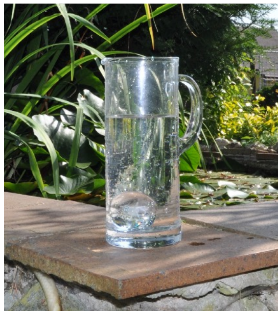
Vibrační zářiče PROMETHEUS - synergický efekt ve spojení s vodou

technologie PROMETHEUS vytváří přirozené prostředí, které přispívá k silnému proudění bioenergie prostředím - tedy i organismem. Je to velmi důležité, protože žijeme ve světě, kde když už jdeme náhodou do přírody, tak si vezmeme boty, které naší nohu stáhnou a gumovou podrážkou nás oddělí od země. Žijeme v domech, kde jsou zdi plné kovových částí a zavedené elektroinstalace. Naše domy izolujeme od přirozeného spojení se zemí, která má přirozenou magnetickou povahu. Dalšími důležitým faktem je všudypřítomné elektromagnetické záření, digitální přenosové sítě, WiFi atp. Všechny tyto aspekty mají elektrickou tedy informační povahu a posilují naši rozumovou stránku, která funguje dle takzvané zkušenostní logiky - tedy z minulosti do budoucnosti. Na základě minulých prožitků si konstruujeme budoucí realitu. Vzhledem k tomu, že naše podvědomí díky implementovaným strachům a obavám akcentuje spíše negativní prožitky, tak většinově konstruujeme scénář, který často není dle našich představ.